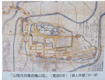
江戸時代の古地図(亀山)